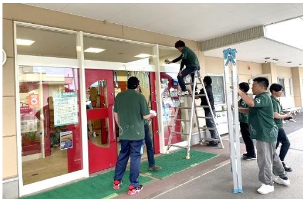
清掃奉仕活動の様子