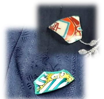
九谷陶片で作ったブローチ

最初に宮本酒造店にて酒造りの説明をお聞きし、古九谷や酒蔵を見せていただきました。次に辰口福祉会館へ移動し、互いの女性部活動を報告した後、昼食をとりながら懇談しました。九谷陶芸村では、売り物にならない九谷焼の陶片をブローチやイヤリングなどに加工する「ハッピーズ」体験と美術館の見学をしました。