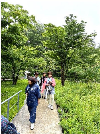
レストランへ続く小路

2日目は宿泊先の清里高原ホテルから、清里テラス、リゾートナレーレヶ岳(星野リゾート)を散策。昼食は化粧品会社のアルソアが運営するオーガニックレストランへ。洗練された建築と小淵沢の自然に囲まれ、贅沢な時間を過ごしました。