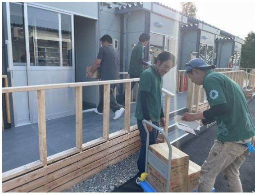
飲料水配布の様子