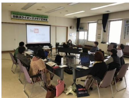
動画編集セミナーの様子

「動画編集活用セミナー」 「動画編集活用セミナー」スマホ動画を編集して、YouTubeで公開!」が1月20日、27日の2日間、田鶴浜支所において開催されました。 セミナーでは、スマートフォンで撮影した動画を加工して、YouTubeにアップロード・公開するまでを説明していただきました。 参加者は、お互いに情報交換しながら動画を作成し、自社のPR手段としてYouTubeを活用していけるような知識を身に付けました。