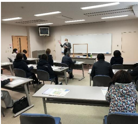
インボイス制度研修会の様子

今回の講習会を通じ、消費税及びインボイス制度に関する知識が部会員内で深まったと感じ