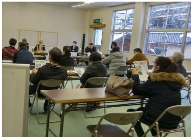
地元市議会議員との懇談会の様子

コロナ禍で落ち込んでいる合宿を令和4年ではコロナ禍前の70%まで戻すことを目標に掲げ取り組んでいくことが伝えられました。